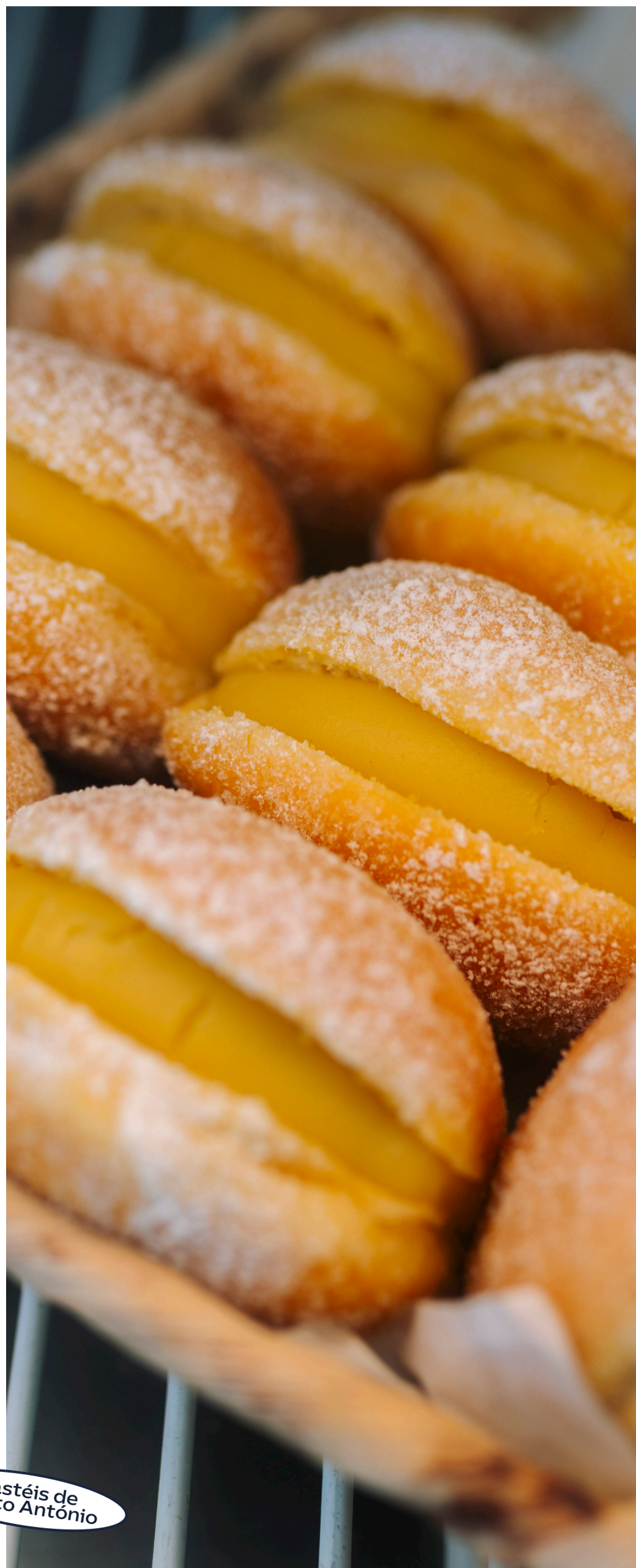
Pastéis de Santo António

Pastéis de Santo António: Avenida Afonso de Albuquerque 227, 285-458 Costa de Caparica. Telefone: 212 900 065. Todos os dias, das 07h às 20h.