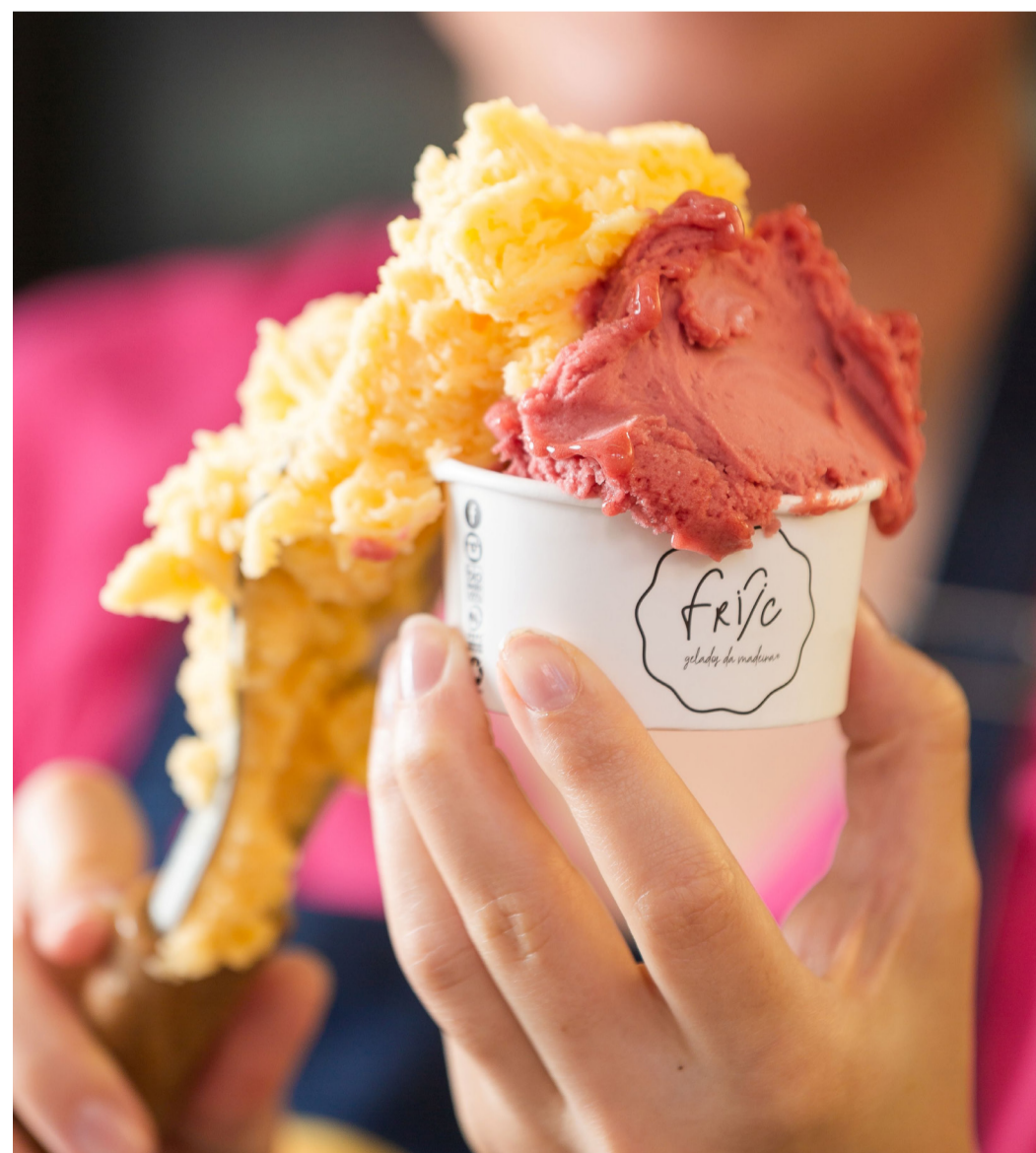
Gelados de Fruta da Madeira

Morada: Tv. Dom Brites, 10, 8800-354, Tavira.