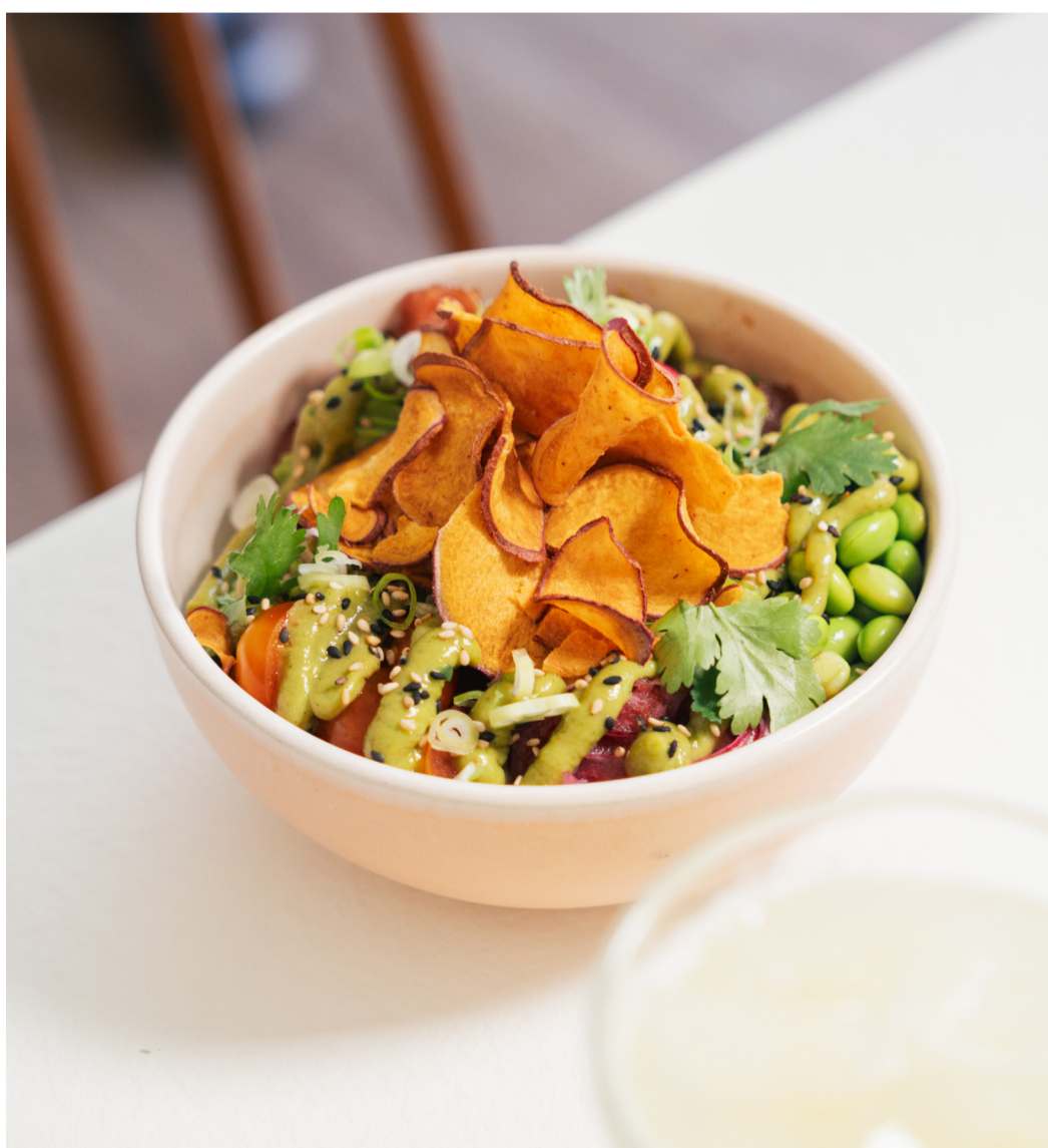
Poke Market

O Calma, em Lisboa, cruza café de especialidade, vinhos bem escolhidos — com foco nos naturais — e uma cozinha leve, pensada para partilhar. Um espaço de produto, equilíbrio e informalidade cuidada, ideal para quem procura beber bem, comer com critério e ficar sem pressa à mesa. Morada: Lg. Agostinho da Silva, 1, 1200-250, Lisboa.